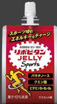
清涼飲料水(ゼリー飲料)